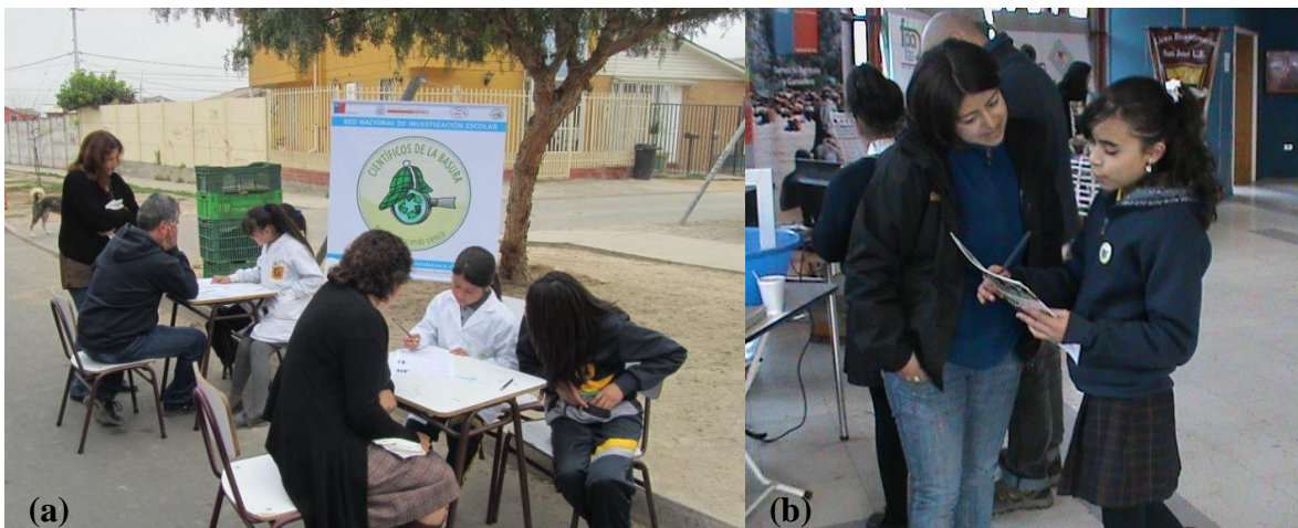
Los escolares entrevistaron a los chilenos: (a) Colegio Eusebio Lillo de Coquimbo y (b) Colegio Litoral Austral de Aysén.

Esta metodología de trabajo se basa en la ciencia ciudadana, la cual integra a los colegios al trabajo científico. De esta forma es posible abarcar una gran cobertura geográfica y obtener resultados a nivel nacional. En esta oportunidad los escolares de todo el país lograron entrevistar a más de 1200 chilenos de todas las regiones costeras del país.