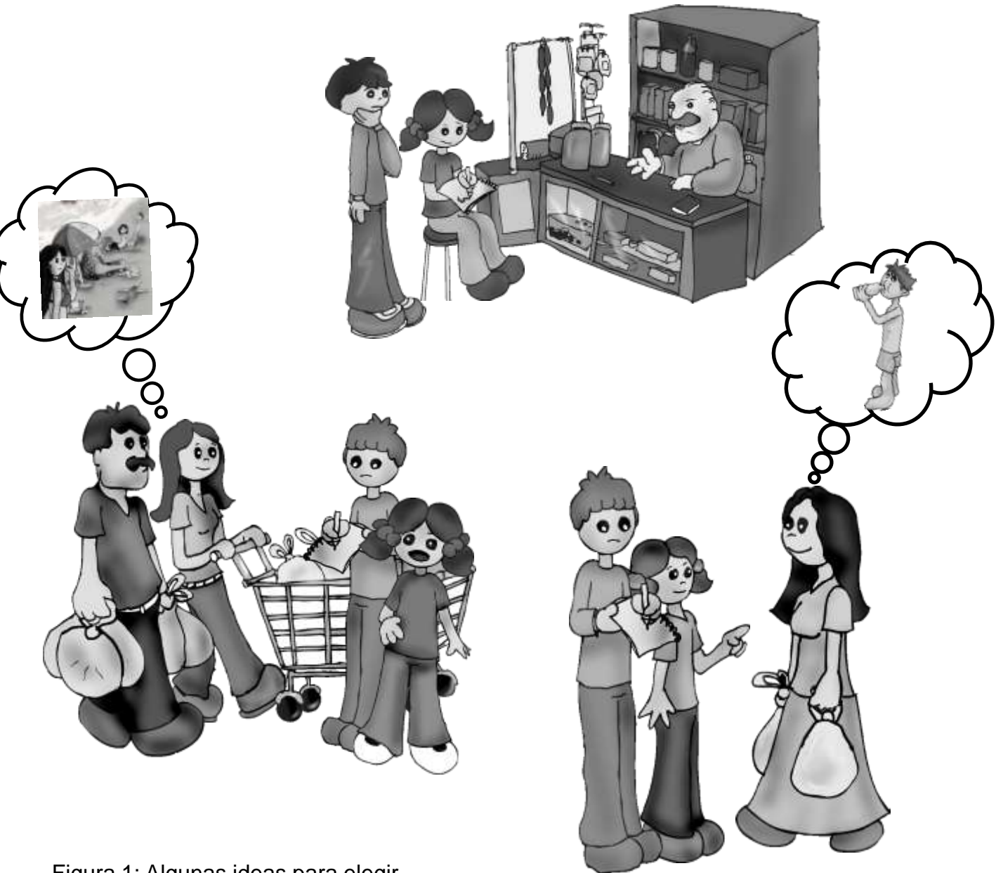
Figura 1: Algunas ideas para elegir los “grupos” de personas a encuestar.